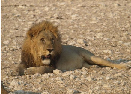
Kalahari Löwe in Etosha