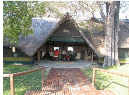
Ndhovu Safari Lodge