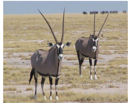
Spießböcke in Etosha