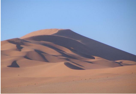
Sterndünen bei Sossusvlei