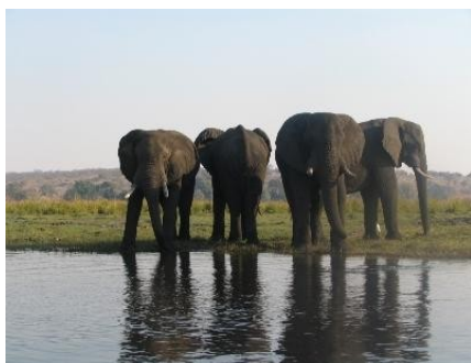
Elefantenbullen am Chobe Fluß