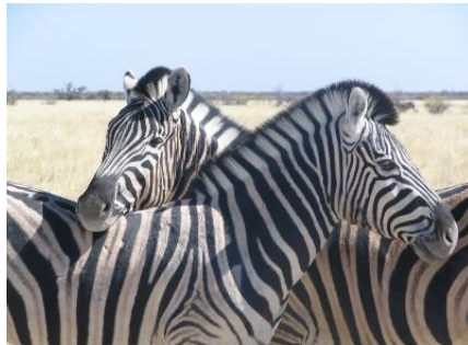
Zebras ruhen sich aus