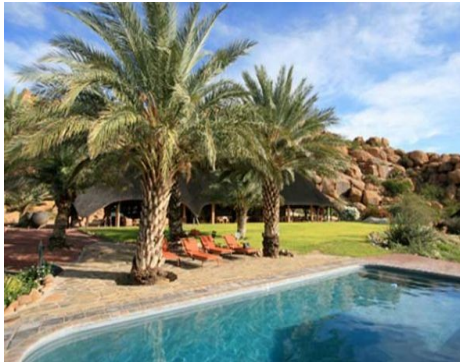
Ai Aiba Lodge Pool

Ü - H/P in der schön gelegenen Ai Aiba Lodge.