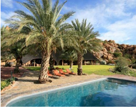
Ai Aiba Lodge Pool

Ü - H/P in der schön gelegenen Ai Aiba Lodge .