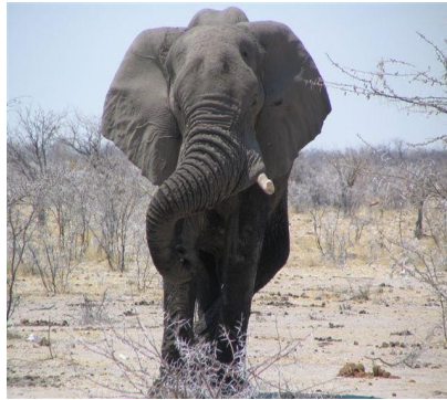
mächtiger Bulle in Etosha