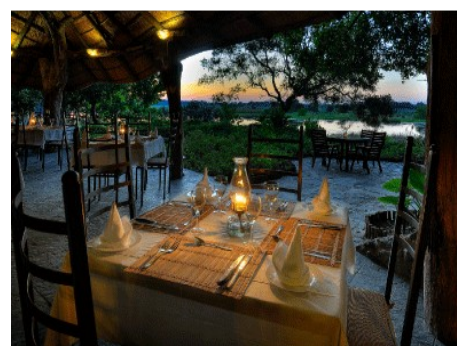
Thamalakane River Lodge ....