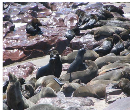
Ohrenrobben am Kreuzkap