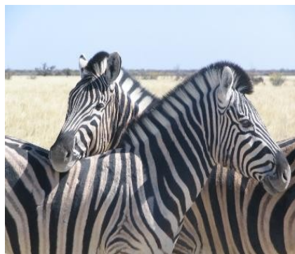
Zebras ruhen sich aus