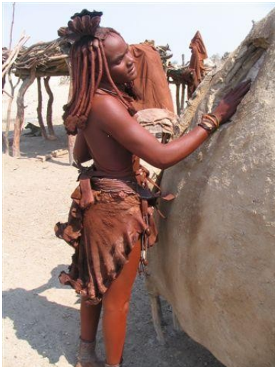
Himba Frau schließt Vorrats-Kammer