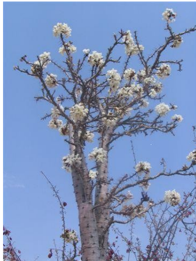
Flaschenbaum in Blüte