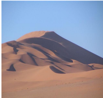
Dünenlandschaft - Sossusvlei